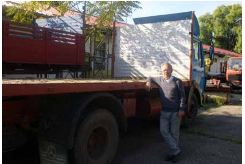
... mit diesem Wander-LKW leicht verschieben kann