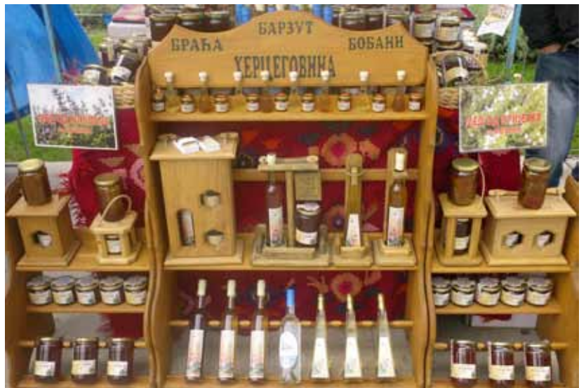
Bienenprodukte in allen Varianten auf dem Imkermarkt in Belgrad.

Rolle in diesem Prozess spielt die orthodoxe Kirche, welche zum festen Bestandteil der nationalen Identität gehört. Gerade deshalb ist die Abspaltung Kosovos so schmerzhaft für Serbien, denn dort liegen die berühmtesten serbischen Klöster, befindet sich quasi die Wiege Serbiens. Und es sind die orthodoxen Klöster, welche seit Jahrhunderten die Kultur der