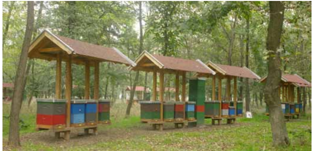
Die Bienenbeuten des Klosters Kovilj in überdachten Freiständen.

Wie fast alle 5000 offiziell registrierten Imker Serbiens imkert Zivoslav mit der Carnica-Biene. Das Trachtangebot ist paradiesisch: In der Tiefebene der Vojvodina werden riesige Rapsflächen angebaut, später blühen hier auf über 100 000 ha Sonnenblumen. In Südserbien und entlang der Donau stehen ausgedehnte Akazien- und Lindenzwälder, die vom ganzen Land aus angewandert werden. Im Norden bietet auf zahlreichen Brachflächen die gewöhnliche Seidenpflanze ( Asclepias syriaca ) eine reiche Nektarquelle, in den Bergen wird Waldhonig geerntet. Serbiens Imker dürfen im langjährigen Schnitt rund 80 kg Honig pro Volk ernten, in guten Jahren auch erheblich