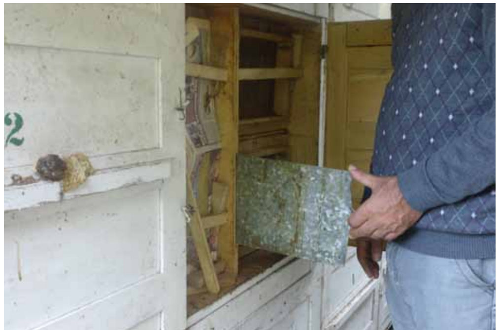
Hinterbehandlungsbeuten mit vertikalem Trennschied.

mehr. Der letzte Sommer aber war katastrophal. Es gab verheerende Überschwemmungen und viele Trachten verregneten komplett. Deshalb wurden «nur» 40 kg geerntet. Zivoslavs Rekord war vor einigen Jahren eine Zunahme des Waagvolks in der Akazie um 15 kg an einem einzigen Tag.