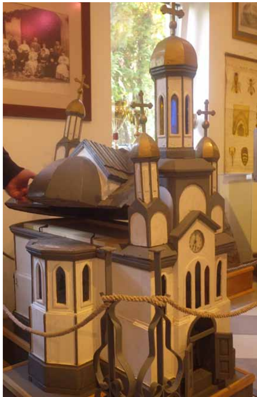
Zierbeute des serbischen Bienenforschers Jovan Zivanovic.

Es ist eine verrückte Imkerwelt! Manchmal lohnt sich ein Perspektivenwechsel, um den eigenen Horizont zu erweitern. Zum Beispiel im unbekanntem Imkerland Serbien. ◻